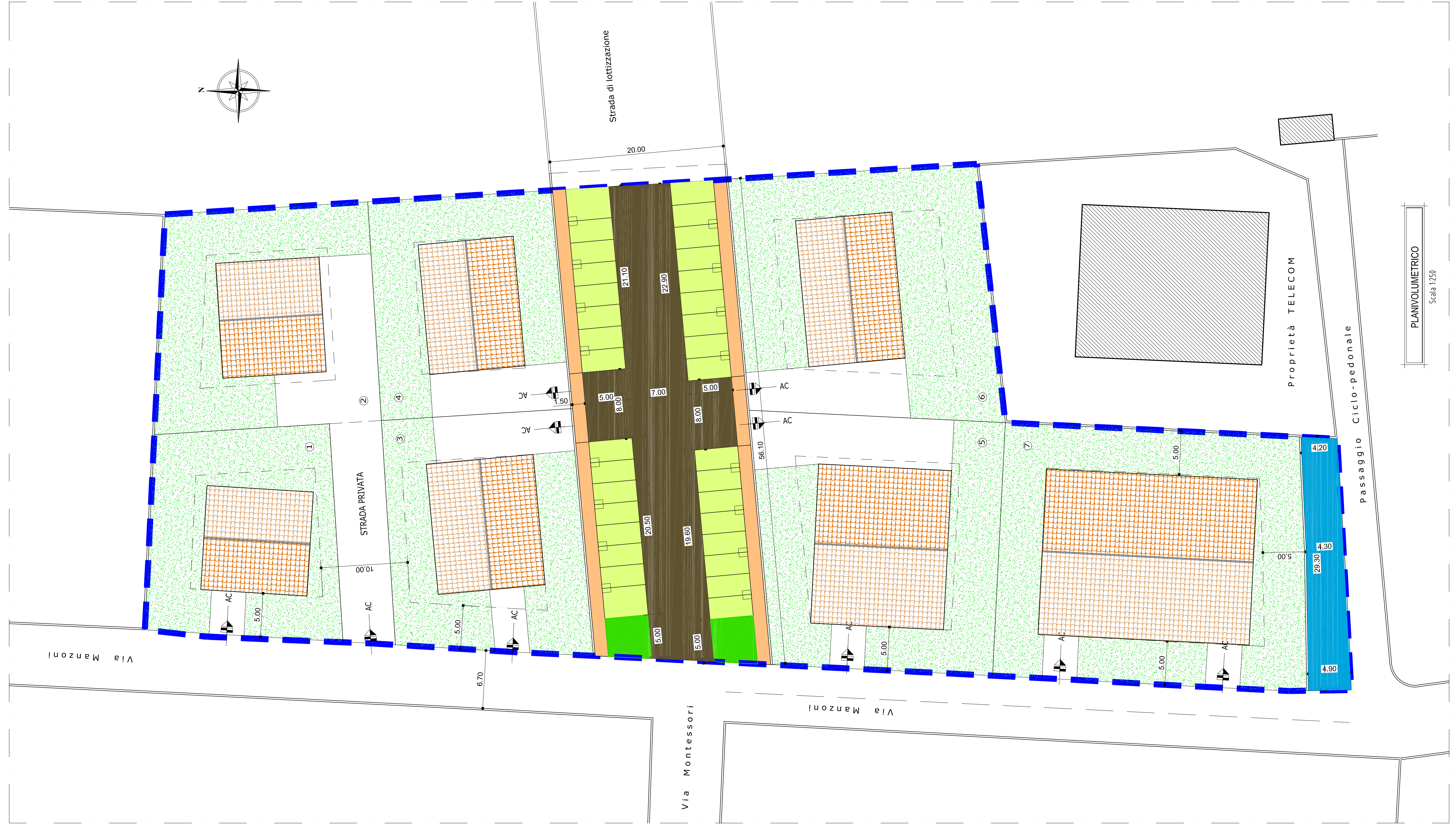
PLANIVOLUMETRICO Scala 1:750

La posizione dei punti centrali è vincolata per quanto riguarda la strada di lottizzazione e può variare in funzione del numero per quanto attiene ai lotti adiacenti. Sono comunque ammessi differenti percorsi di penetrazione ai lotti di carattere privato.